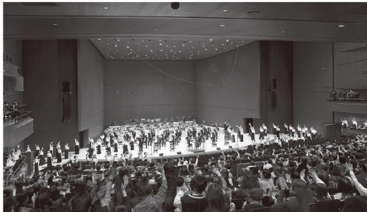
2020年 第47回演奏会フィナーレ

1974年創立、2006年NPO法人化、ベートーヴェン第九交響曲を群馬交響楽団と共に群馬音楽センターの舞台上で演奏してきた。1989年当時西ドイツのハイデルベルグ市において日本の第九合唱団初となる海外公演を行い、全国的な注目を浴びる。以後EU各国においてこれまで9回公演。2008年音楽による平和活動と国際交流活動が評価され、群馬県国際交流賞を受賞。国内では年末の「高崎の第九」演奏会のほか5月にはメイコンサートを開催しオペラや各国の歌を披露している。団員は年齢も様々であるが、ベートーヴェンの音楽を愛し「第九」の人類愛の精神を歌い、音楽による平和と国際文化交流を目指すことを共通の理念として活動を続けている。2019年9月には高崎芸術劇場開館記念演奏会(こけら落とし公演)に出演。2020年には、コロナ禍で開催できた「第九」として全国から注目と称賛を集めた。2022年10月にはウィーン楽友協会での公演を予定しており、さらに未来へ歌い継ぐことを目指す。